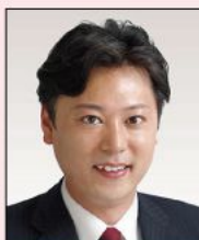
山形県議会議員 斎藤 俊一郎