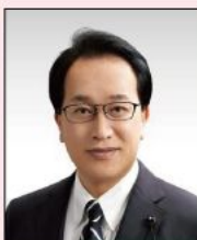
山形県議会議員 梅津 庸成