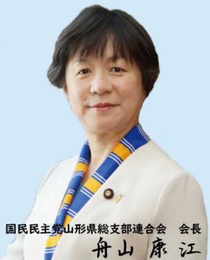
国民民主党山形県総支部連合会 会長 舟山 康江

党员、サポーターの募集が始まりました。政治不信を払しょくし、明るい未来を築き上げるために、皆様のお力をお貸しいただき、ともに力を尽くしていくことができればと思います。どうぞよろしくお願いいたします。