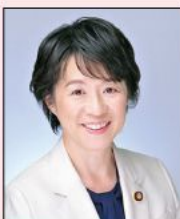
参議院議員 舟山 康江