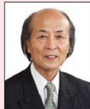
元山形県議会議員 青柳 安展